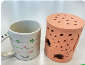
[陶芸] マグカップ&ランプシェード