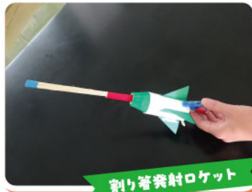
割り箸発射ロケット