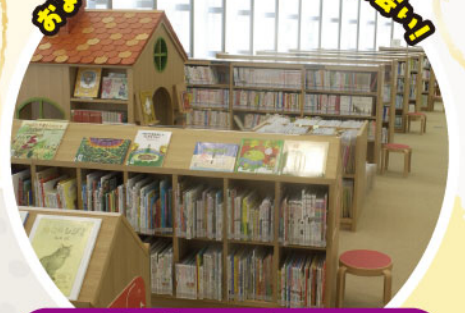
子どもライブラリー