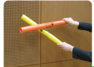
ブームワッカーで音遊び