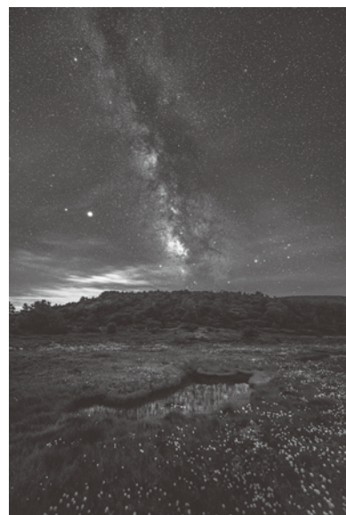
「高原が輝くとき(浄土平)」