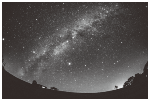
「真剣勝負(鹿角平天文台)」