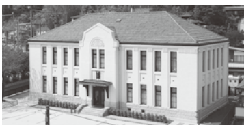
福島市写真美術館 (通称:花の写真館)