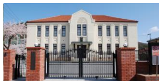
福島市写真美術館 (通称:花の写真館)