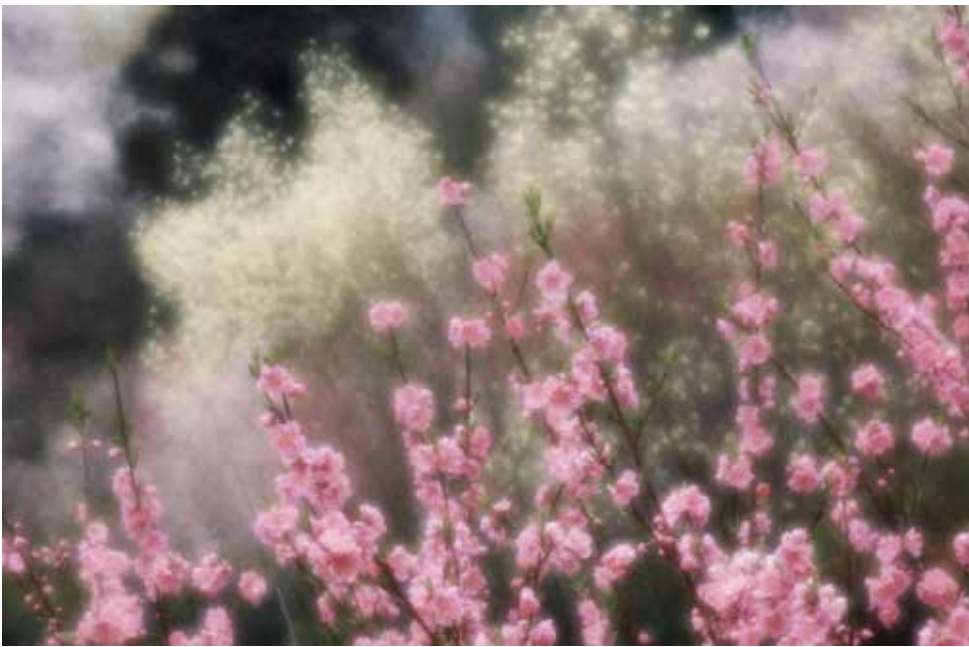
花見山公園にて(1991年)

主催: 福島市、福島市写真美術館(公財)福島市振興公社 協力: 秋山庄太郎写真美術館、(株)スリーノーマン、(株)第一印刷、秋山庄太郎写真芸術協会、びあのおもてなし隊 後援: NHK福島放送局、福島民報社、福島民友新聞社、福島テレビ、福島中央テレビ、福島放送、テレビユー福島、ラジオ福島、ふくしまFM、福島コミュニティ放送FMボコ