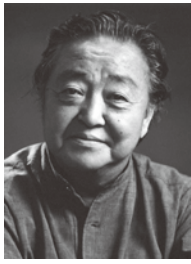
秋山 庄太郎 あきやま・しょうたろう

(1920～2003) 東京・神田生まれ。女優ポートレートを数多く手がけ、第一線に立つ写真家としての地位を不動のものにする。さまざまな写真関連団体の重職を務め、写真文化の発展に尽力。ライフワーク「花」により写真芸術の大衆化に貢献。1970年代以降、当時「知る人ぞ知る」地であった福島市郊外の花見山公園を「桃源郷」と絶賛し、同園の名を全国に広めた。1986年紫綬褒章、1993年旭日小綬章を受章。2001年福島市ふるさと栄誉賞を受賞。