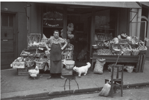
「パリの四カ月」より(1960年)